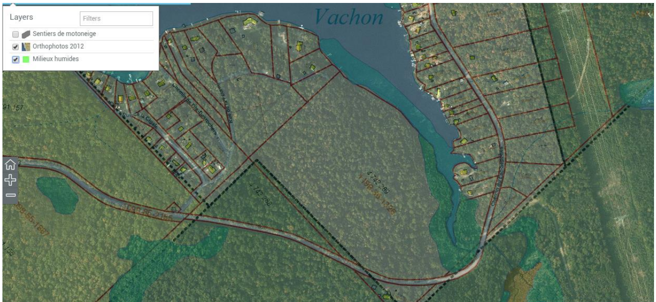
Sur cette figure, on voit deux différents milieux humides répertoriés, en bleu et vert.